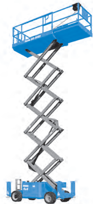
Abb. nur zu Illustrationszwecken. CE Maschinen sind mit Scherenschutz-Paket ausgestattet.